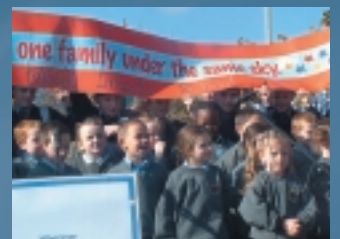
Commemoración del Día Internacional de la ONU para eliminar la pobreza, Dublín, 17 de octubre de 2003

Los principales campos de actividad de EAPN Irlanda corresponden en general a las grandes líneas de los temas que sigue de cerca la red europea: inclusión social, empleo, Fondos estructurales, ampliación y futuro de Europa. Este año, la red ha privilegiado la Convención sobre el futuro de Europa, proceso en el marco del cual hemos conseguido suscitar un debate nacional sobre los temas de política social.