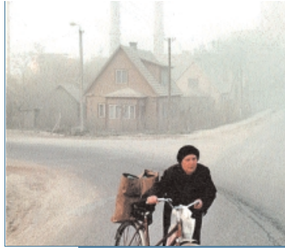
Kunda, Estonia