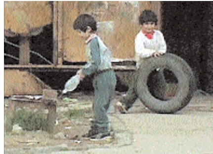
Niños Roma en un solar abandonado, Eslovaquia