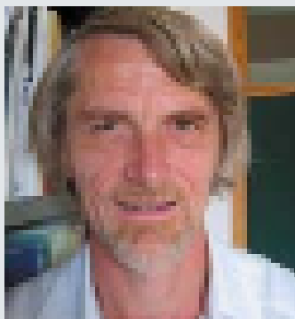
Philippe Van Parijs enseña Ética de la Economía y Pensamiento Político en la Universidad Católica de Lovaina (Bélgica) y en la de Harvard (EE.UU.). Es uno de los fundadores de la Basic Income Earth Network (BIEN).