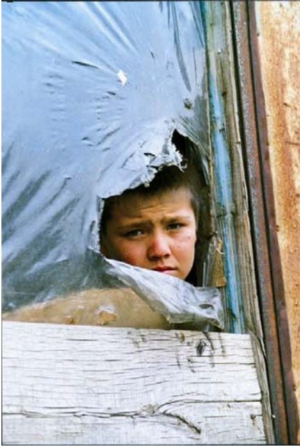
Refugee camp (Serbia and Montenegro)

indflydelse ser ud til at vække bredere opmærksomhed, er der kun lidt forskning omkring den indflydelse globalisering har på vore samfund og individer. Imidlertid er det også svært at modsige argumentet, at de største byrder af denne proces falder på skuldrene af dem, der er mindst udstyret til at konkurrere i vore for evigt konkurrerende globale økonomier og samfund. Globalisering, som ethvert andet menneskedrevet fænomen er ikke styret af naturlove. I stedet er det formet af politiske beslutninger taget af dem, der er med i det. Og, uheldigvis, har vi siden 90'erne stået overfor et herskende neoliberalt paradigme, som har prøvet at prise markedet som det mest effektive og hensigtsmæssige instrument for økonomiske vækst og social udvikling. Men virkeligheden er, at enhver omfattende økonomisk og social forandring medfører vindere og tabere. Og markedet gør meget lidt – hvis overhovedet noget – for taberne. Under disse omstændigheder er det institutionernes rolle at hjælpe med at styre forandringsprocessen – at maksimere de økonomiske muligheder for alle, og at udstyre folk til at kunne drage fordel af disse muligheder.