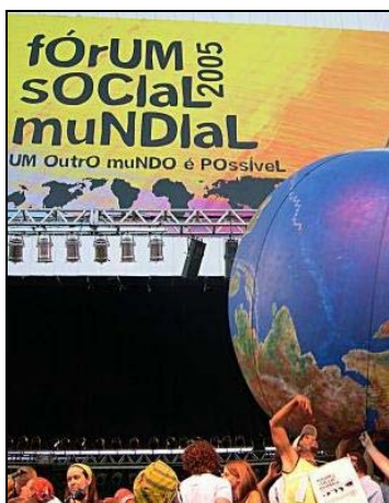
WSF 2005

Det næste Europæiske Sociale Forum (ESF) finder sted i Athen i april 2006. Ifølge ESF websitet, "er det et åbent mødested, hvor civilsamfundsgrupper og bevægelser, der er imod neoliberalisme og en verden domineret af kapital eller anden form for imperialisme, men engageret i at opbygge et samfund grundlagt på det menneskelige, kan mødes". Mere information på ESF: http://www.fse-esf.org/