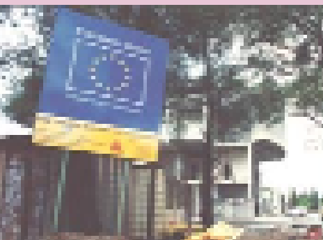
Construcción de un parque de bomberos. Podgorica. Serbia y Montenegro © EC/A. Zrno

La Unión Europea es el mayor comerciante del mundo y el que más ayudas da.