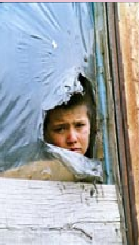
Campo de refugiados. Serbia y Montenegro.

Held, David and McGrew, Anthony: Polity Global Transformations, sitio de texto: http://www.polity.co.uk/global