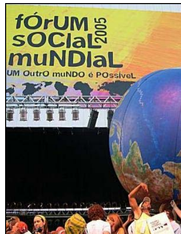
WSF 2005

2006 áprilisában Athénban rendezik a következő Európai Szociális Fórumot (ESzF). Az ESzF honlapja szerint „a fórum egy mindenki előtt nyitott rendezvény, ahol a neoliberalizmust és a tőke vagy az imperializmus bármely más formája által uralt világrendet ellenző, ugyanakkor az emberközpontú társadalom építése iránt elkötelezett csoportok találkozhatnak”. Bővebb információk az ESzF-ről: http://www.fse-esf.org/