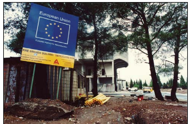
Bouwwerkzaamheden aan het gebouw van de brandweer - Podgorica (Servië en Montenegro)

Zie ook 'De EU in de wereld' op : http://www.europa.eu.int/comm/world/