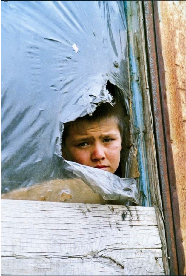
Vluchtelingenkamp (Servië en Montenegro)

komen over - of bewijs kunnen vinden voor – wat de positieve en negatieve impact is van globalisering op onze economieën, onze samenlevingen en op ons – als individuen die ermee geconfronteerd worden. Hoewel de economische impact van globalisering een brede interesse lijkt op te roepen, is er weinig onderzoek naar de impact van globalisering op onze samenlevingen en individuen. Het is echter eveneens moeilijk om het argument tegen te spreken dat de zwaarste lasten van dit proces worden gedragen door diegenen, die het minst toegerust zijn om te concurreren in onze steeds meer concurrerende wereldeconomieën en -samenlevingen. Zoals elk verschijnsel dat door mensen wordt veroorzaakt, wordt globalisering niet beheerst door natuurwetten. Het wordt daarentegen vormgegeven door de politieke besluitvorming van de betrokken actoren. En helaas worden we sinds de negentiger jaren geconfronteerd met een heersend neo-liberaal paradigma dat geprobeerd heeft de markt te prijzen als het meest efficiënte en geschikte instrument ter bevordering van economische groei en sociale ontwikkeling. De realiteit is echter, dat elke