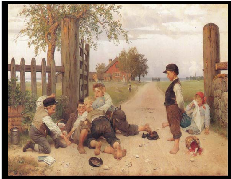
Grindslanten - August Malmström 1885

När vägförande passerade en grind stod ibland barn där för att öppna den. De fick då en grindslant. Målningen visar på ett bra sätt den svenska delegationens erfarenhet av hur det är att vara fattig.