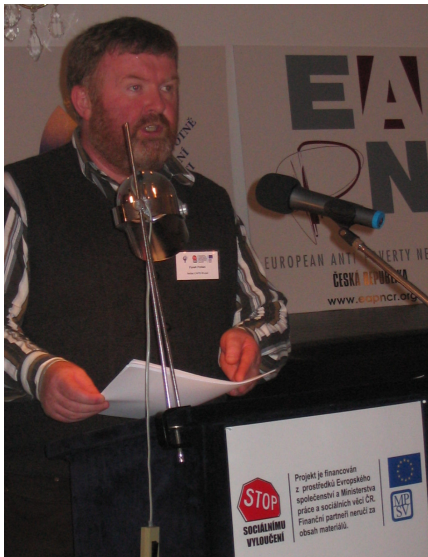
Fintan Farrell při vystoupení na konferenci v Opavě

která se konala ve dnech 4. – 5. října 2007 v Opavě. Navštívil ji i ředitel EAPN Europe Fintan Farrel a přednesl zásadní příspěvek „Podíl NNO na sociálním začleňování“. Konference prokázala živý zájem veřejnosti angažované v řešení sociálních otázek, zahájila šíření myšlenky mainstreamingu sociálního začleňování v ČR a na příkladech z ČR a zahraničí ukázala působivá konkrétní řešení. Mezinárodní den za vymýcení chudoby 17. 10. 2007 – zaznamenali jsme aktivity Armády spásy, Charity Ostrava a Města Opavy.