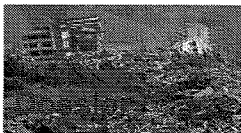
Violent séisme en Haïti