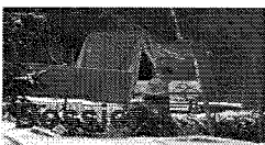
Les tueurs en série belges