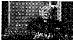
Mgr Léonard nommé cardinal

Belgique Monde Showbizz Politique Economie