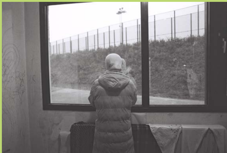
Centre de détention 127bis, Belgique, femme sur le point d'être expulsée

Plutôt que de soutenir la société civile dans sa lutte contre les formes les plus extrêmes de pauvreté en Europe, certains Etats membres vont jusqu'à criminaliser les organisations et les individus qui apportent leur aide aux migrants sans-papier, qui allègent leur souffrance ou tentent de leur garantir un minimum de dignité humaine. En France, depuis 1986, au moins 30 personnes ont été poursuivies en justice pour assistance à migrants sans-papier, la plupart d'entre elles pour la simple raison qu'elles ont offert un logement à un sans-papier. 5 En 2007, l'organisation chypriote-grecque KISA a été poursuivie devant les tribunaux pour avoir récolté des fonds afin de financer une opération chirurgicale censée sauver la vie d'un travailleur domestique migrant. 6