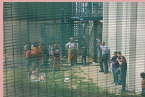
127bis, centre de détention, Belgique

« Ce sont des êtres humains ; personne ne voudrait vivre ce qu'ils endurent et ce qu'ils continuent à endurer ».