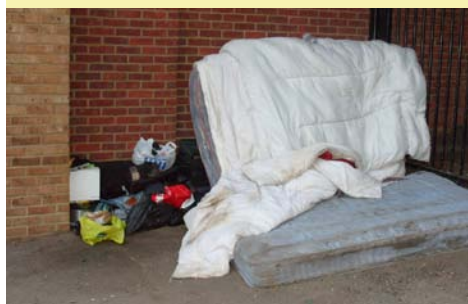
Où dort un groupe d'immigrés polonais sans-abri, R-U