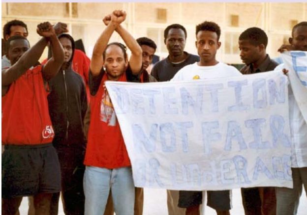
Détention (Malte, HAL FAR, centre de détention de migrants)

« Migrant Voice » est une organisation gérée par des migrants dans le but de les rassembler autour d'une stratégie commune pour renforcer leur influence, leur participation et leur représentation dans les médias et dans la sphère politique. Ils pourront ainsi rencontrer leurs besoins et participer pleinement à la société. Pour de plus amples informations, veuillez contacter: info@migrantvoice.org ou consulter le site : www.migrantvoice.org