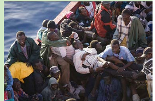
Arrivée d'un cayuco avec 229 Africains migrants à bord au port de Los Christianos à Tenerife, Espagne

Au niveau national, l'immigration relève de la responsabilité du Ministère de l'Emploi et de l'Immigration. Tous les membres d'EAPN et les autres acteurs de la société civile ont envoyé des propositions à ce ministère afin que la régularisation, qui suivra l'adoption du décret