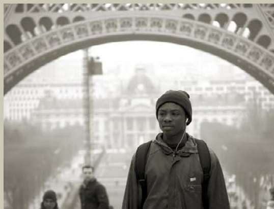
Portrait d'un commerçant « illégal », Paris

Une charte de l'accueil des migrants dans les administrations publiques pourrait être utile aux agents d'accueil.