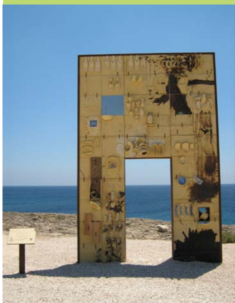
Lampedusa, Italie, monument de Mimmo Paladino dédié aux migrants morts en tentant d'atteindre les côtes européennes

Le processus européen de protection sociale et d'inclusion sociale peut contester l'idée selon laquelle certaines franges de la population, parce qu'elles ont le statut d'illégaux, ne méritent pas les protections sociales de base. Toutefois, d'emblée, les populations les plus vulnérables d'Europe ont été victimes de ségrégation sur base de leur statut administratif. En conséquence, le processus d'inclusion sociale et de protection sociale a non seulement échoué, mais il risque de créer, au sein de la société européenne, « un quart-monde » plus divisé, plus marginalisé et plus facile à exploiter.